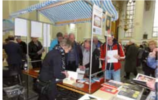
De historische markt na afloop van de diesviering werd eveneens druk bezocht.

warm hart toedragen. Voor de kinderen was er een tekenwedstrijd met leuke prijzen. Tevens werd de Historische Kalender 2018 - in het teken van het openbaar vervoer - te koop aangeboden. Burgemeester Lenferink nam eerder op de dag al het eerste exemplaar van dit door de Beeldbank vervaardigde pareltje in ontvangst.