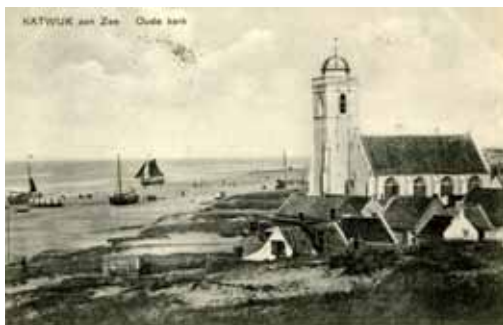
Katwijk in 1910 (fotoğraf onbekend; uitgever van de briefkaart: Katwijksche Boek- en Kantoorboekhandel).

Op de plaats van dit Oude Kerkje, in de volksmond het Witte Kerkje, werd in ongeveer 1461 een kerk gebouwd die gewijd was aan de apostel Andreas. Tijdens het beleg van Leiden werd de kerk vernield. In 1640 werd de kerk herbouwd en vergroot en gebruikt voor de eredienst van de