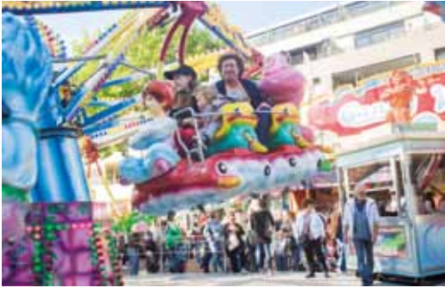
Attracties op de Leidse Kermis voor alle leeftijden.