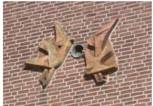
Gevelreliëf vlaggenstokhouder door Jacques van Rhijn.

'Wie in de werelt wil verkeeren, vrank en veilig En leeren ommegaan met heiligh en onheiligh In 't hof en op de merkt, vindt hier het onderwijs Den leitsman, die hem leidt voor een geringen prijs'