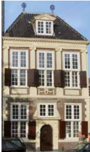
De Bibliotheca Thysiana aan het Rapenburg.

U kunt zich vanaf 1 maart 2018 opgeven voor deze excursie. De excursieprijs is 13,50 euro voor leden en 15,50 euro voor introducés (inclusief toegangsprijs en koffie).