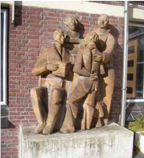
Beeldengroep door Jacques van Rhijn.

Monumentale kunst wordt vooral aangetroffen in schoolgebouwen. Sinds 1933 staat aan de Mariënpoelstraat het gebouw van het huidige Bonaventura College, oorspronkelijk de HBS St. Bonaventura, gesticht door de orde van Franciscanen. De uitbreiding van de HBS tot lyceum en het groeiende leerlingenaantal leidden in 1955 tot de bouw van een nieuwe vleugel. Het schoolarchief geeft een aardig beeld van de aandacht die daarbij aan de kunst voor het gebouw werd gegeven.