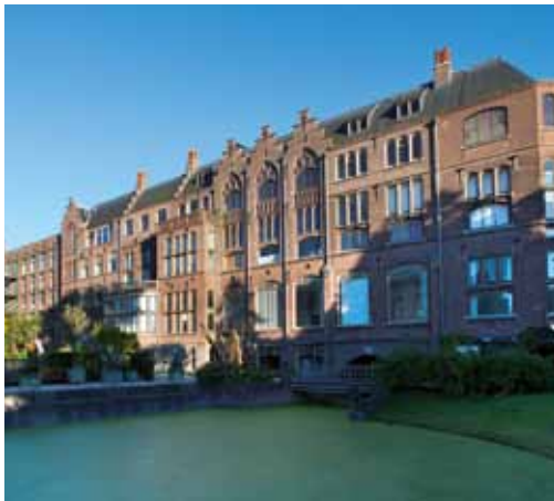
Het P.J. Vethgebouw aan de Nonnensteeg 1-3.