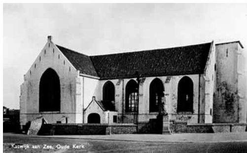
De Katwijkse kerk zonder toren (fotoğraf onbekend).

Hervormde gemeenschap. In de oorlog moest de kerktoren op last van de Duitsers worden afgebroken, omdat deze als oriëntatiepunt zou kunnen dienen voor de geallieerden. Dit gebeurde tot op de hoogte van het kerkgebouw. In 1952 werd de torenspits in een iets andere stijl weer opgebouwd.