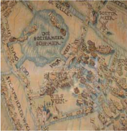
Detail uit een wandtapijt over het ontzet van Leiden; de slag bij Zoetermeer.

Leiden Nieuws kunt u hier nadere informatie over verwachten.