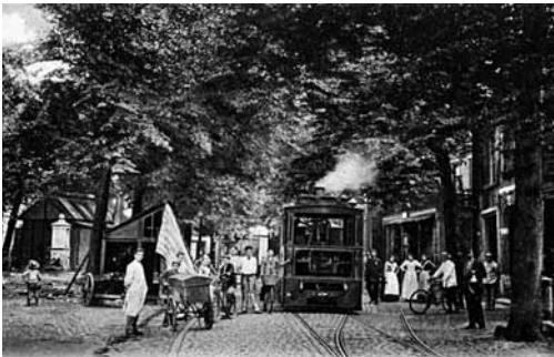
Hillegom 1903.

tram, de verbinding tussen Leiden en Hillegom. Uit de houding van de mensen kan worden afgeleid dat de fotograaf hen heeft gevraagd even stil te staan, omdat beweging leidt tot een onscherpe foto.