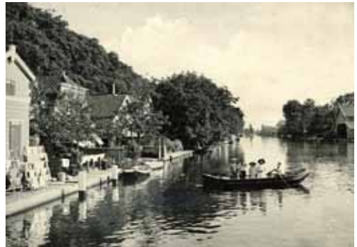
Alphen aan den Rijn in 1912.

De foto rechts toont de Oude Rijn tussen Alphen en Oudshoorn met een voetveer. Ook hier even poseren voor de fotograaf.