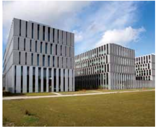
Het Gorlaeus Building aan de Einsteinweg 55.

en in het gebied Witte Singel-Rijn en Schiekade. Otterspeer onderscheidt in de huidige ruimtelijke spreiding drie campussen: de Leidse binnenstad voor geesteswetenschappen en rechtsgeleerdheid, de vrije ruimte tussen Leiden en Oegstgeest voor geneeskunde en exacte wetenschappen en Den Haag voor bestuurlijke en sociale wetenschappen. In het boek wordt die indeling ook aangehouden. In de binnenstad worden 25 locaties belicht en in het Bio Science Park 21. Vogelvluchtopnamen van Hielco Kuipers, recente foto's van de exterieurs en interieurs van de Leidse gebouwen, gemaakt door Marc de Haan en beelden van memorabele momenten vormen de illustratieve elementen. Samen met de informatieve teksten over zowel historie als actualiteit maken het tot een fraai naslagwerk.