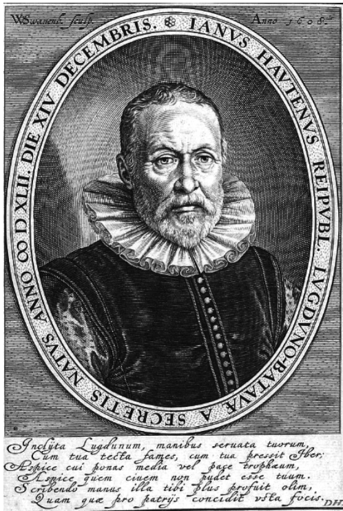
Jan van Hout (1608, Koninklijke Bibliotheek).

verschillende netwerken zo goed vervlochten, zelden werd zo eensgezind (ja in diepe vriendschap) gewerkt aan één gemeenschappelijk doel: een academie voor stad en land te stichten die de verbazing van de hele geleerde wereld zou opwekken.