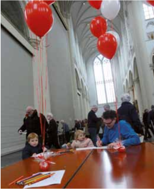
Er was een speciaal hoekje voor jeugdige tekenaars.