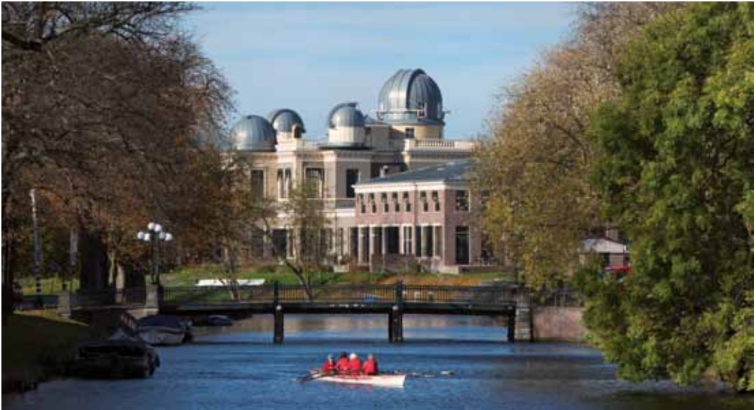
Sterrewacht aan de Sterrenwachtlaan 11.