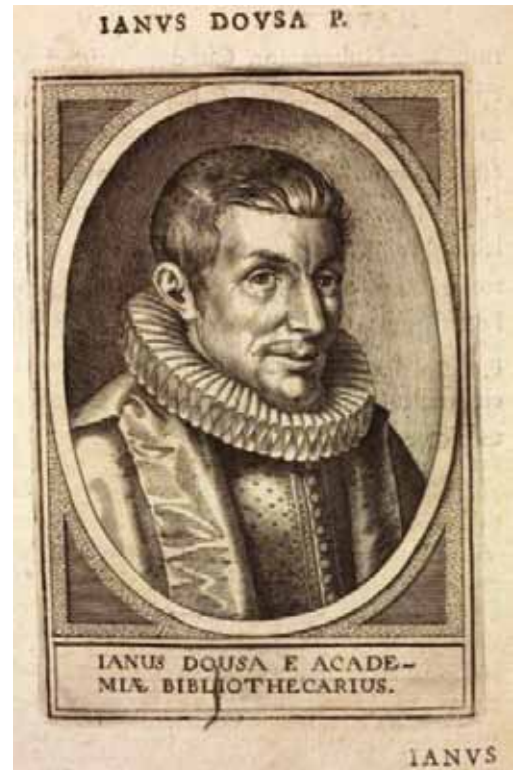
Jan van der Does (Janus Dousa).