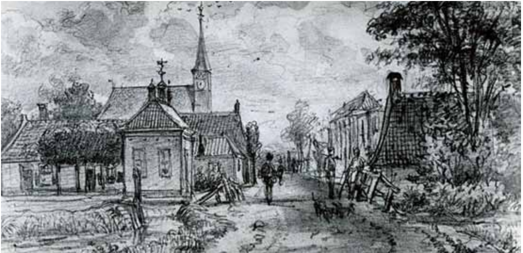
Leiderdorp, eind 19e eeuw (tekening: J.E. Kikkert).