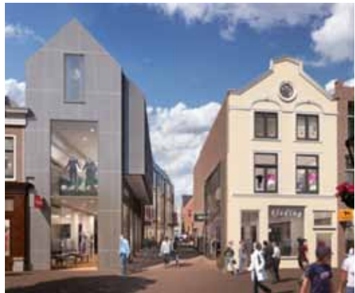
De Catharinasteeg

Want, zoals wij eerder hebben gemeld, hebben we eerst bij de rechter en vervolgens bij de Raad van State beroep respectievelijk hoger beroep aangetekend tegen de omgevingsvergunning voor de aanleg van een megaterras van Annie's, daar waar de twee Rijnarmen in het centrum van de stad samenvloeien. Een terras dat ook volgens het college van B&W een te ernstige aantasting vormt van het beschermd stadsgezicht. De procedure bij de Raad van