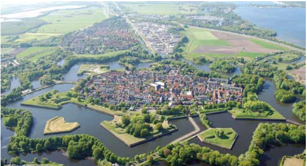
Naarden vesting.

U bent pas definitief ingeschreven na betaling. Tot 10 dagen voor de excursiedatum kunt u kosteloos annuleren. Graag direct na de aanmelding de excursiekosten overmaken op bankrekening NL67 INGB 0005 9012 64 t.n.v. Vereniging Oud Leiden (Pas op: de rekening voor de contributiebetaling heeft dezelfde tenaamstelling). Vermeld bij de betaling uw HVOL-lidmaatschapsnummer, de excursie waarvoor u inschrijft en de naam van uw eventuele introduc e.