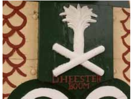
De molenbaard met de naam van de molen en het molenteken (foto: Hans de Sterke).

Het molenteken en de naam op de gevel van het zaaghuis zijn in de loop van de jaren verschillende keren opnieuw geschilderd. Er is kennelijk geen vast ontwerp geweest, want we zien flink wat variatie in de manier waarop ze worden weergegeven. Het bestuur van de stichting Houtzaagmolen de Heesterboom heeft de historische varianten bestudeerd en een keuze gemaakt voor het ontwerp dat op de molen wordt afgebeeld. Welke variant het is geworden, zal blijken wanneer het gevelteken feestelijk wordt onthuld.