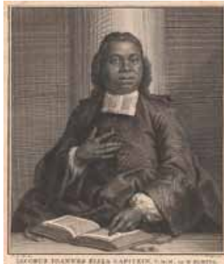
Jacobus Capitein, een vrijgelaten slaaf die in Leiden theologie studeerde (1742).

Na de toelichting van Oostindie waarom het boekje is geschreven was er gelegenheid voor het stellen van vragen. Daarvan werd goed gebruikgemaakt. Zo kwam ter sprake of de slavenhandel rendabel was. Zowel de handel als de exploitatie van slaven, vooral op plantages, was doorgaans winstgevend, maar de risico's waren groot en dus waren de in de 18de eeuw in toenemende mate geïnteresseerde investeerders uit de elite wel eens zwaar teleurgesteld. Ook werd gevraagd naar de transporten van slaven over de Indische Oceaan, vergeleken met die over de Atlantische, want die werden in de lezing (en het boekje) niet behandeld. Daarvan is minder bekend. Omdat Aziaten in Azië bleven, vielen ze ook minder op door een andere huidskleur. De vraag of ook gewone Leidenaren van de slavernij profiteerden, werd terughoudend beantwoord: de export van Leids textiel naar Afrika en Amerika zorgde voor wat extra werkgelegenheid, maar per saldo zal het niet geweldig zijn geweest. Ook zijn er in Leiden geen gebouwen aan te wijzen die dankzij de met slavernij behaalde winsten gefinancierd konden worden; hoogstens zou de suikerraffinaderij van Julien Parat aan de Langegracht daartoe gerekend kunnen worden, maar die ging al na zeer korte tijd failliet. Ook over Zwarte Piet staat niets in het boekje; de relatie met zwarte huisslaven