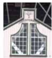
Vershillende varianten van het molenteken van D'Heesterboom.